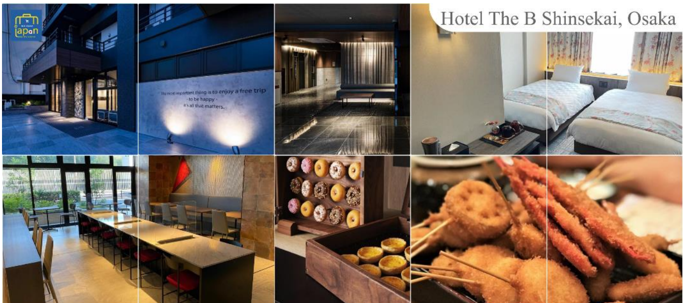
Hotel The B Shinsekai, Osaka

พักที่ HOTEL THE B SHINSEKAI, OSAKA หรือเทียบเท่าระดับเดียวกัน