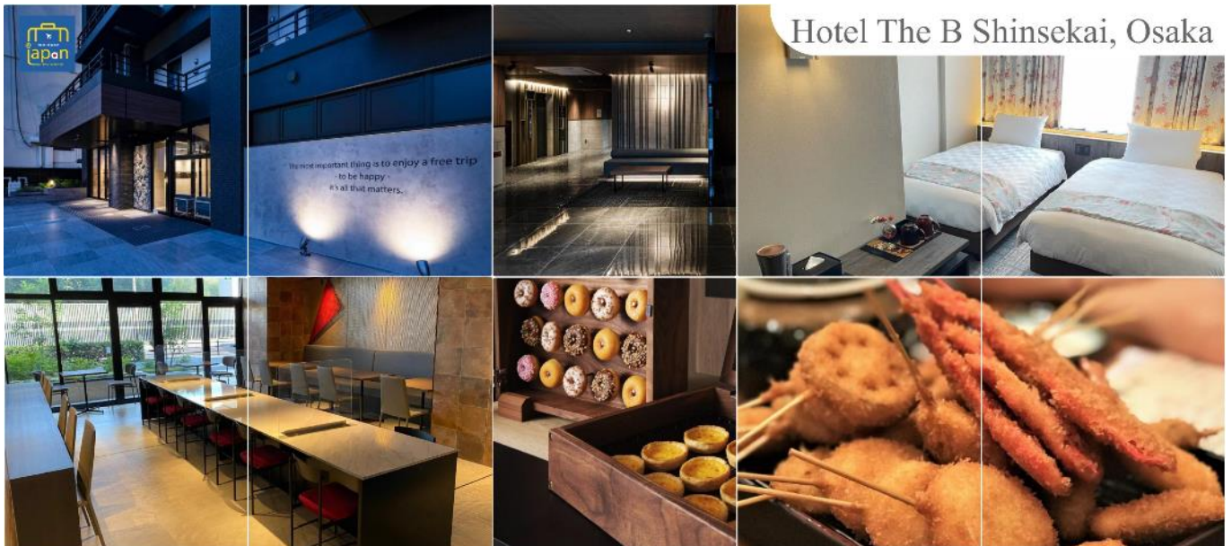
Hotel The B Shinsekai, Osaka

พักที่ HOTEL THE B SHINSEKAI, OSAKA หรือเทียบเท่าระดับเดียวกัน